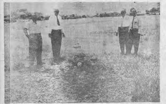
PROFUNDA ZANJA EN LA PISTA DE LA SABANA dejó con sus enormes ruedas el pesado Curtiss TI-1007 porque se le atravesó un hombre al que las hélices seccionaron de un tajo su mano derecha. Nadie se explica cómo este hombre no quedó reducido a minúsculos trozos. En la gráfica, de la