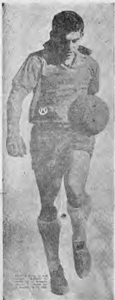
Honorio Landa el más incisivo y peligroso delantero de la selección chilena. Es tenido por su potencia en el shut. Mañana alineará contra Brasil en las semifinales.