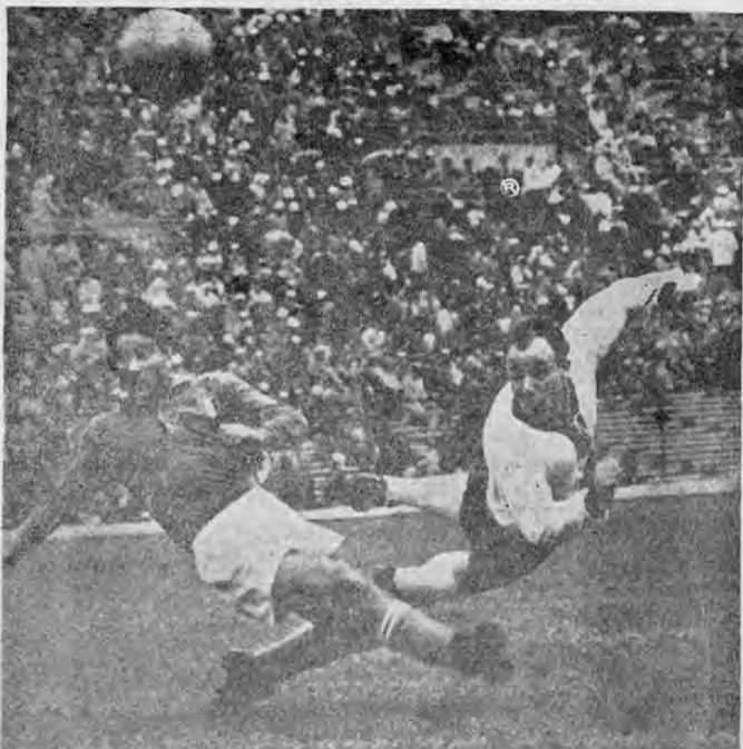
Uwe Seeler centro delantero de la selección alemana de futbol lo vemos en acción frente a Italia. Es el jugador que más ha gustado en Chile por su codicia y empuje.