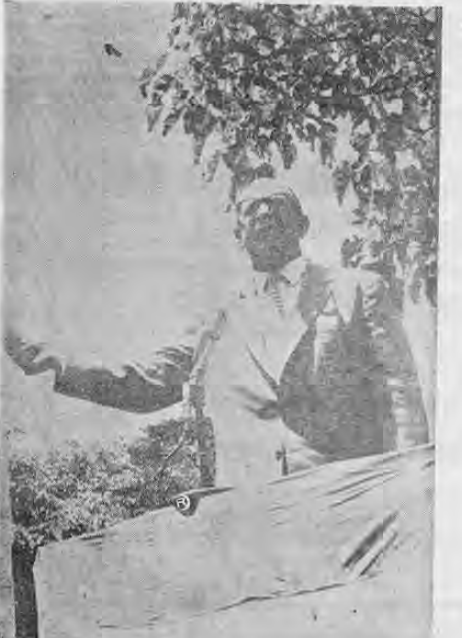
Presidente Orlich en momentos de pronunciar su discurso

El discurso del Presidente Orlich, fue interrumpido va- rias veces por nutridos aplau- sos de la gran concurrencia re- ñida en las oficinas de la Jefatura Política de San Isi- dro de Heredia.